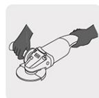
Operación a dos manos