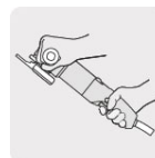
Cuerpo ergonómico compacto y ligero